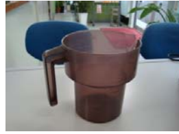
ピッチャー(水入れ)